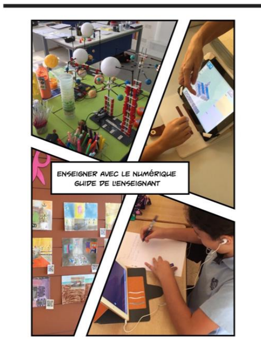
Série Guides numériques AFLEC

Il s'agit du manuel idéal pour réfléchir à son action pédagogique et se rassurer en débutant avec des choses simples et faciles à mettre en œuvre.